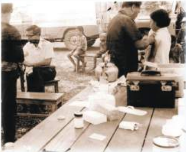
หน่วยแพทย์เคลื่อนที่ กรป.กลาง ออกช่วยเหลือราษฎร

It was also tasked to command National Central Security Command, founded in 1962, to coordinate and integrate all capabilities of government agencies, be they civilian, police and military, to protect and suppress the threat of insurgency by implementing concurrently policies of development and protection.