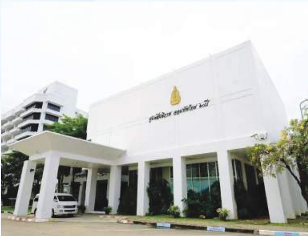
Peace Operations Centre Building to Commemorate The 60th Anniversary of Ascension to the Throne of H.M. the King as the Highest Commander of the Royal Thai Armed Forces.

Furthermore, in 2006, the Supreme Command Headquarters underwent another restructuring to enhance its capacity in security cooperation, for example, by upgrading "Peace Operations Division" to "Peace Operations Centre, Directorate of Joint Operations" to serve as a staff, education, and force preparation unit, as well as for planning, directing, and coordinating in deploying troops to peacekeeping operations;