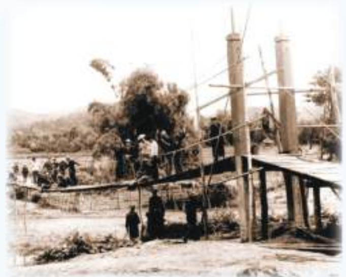
การก่อสร้างสะพานบ้านนาหนูน ต.ผาตอ อ.ท่าวังผา จ.น่าน