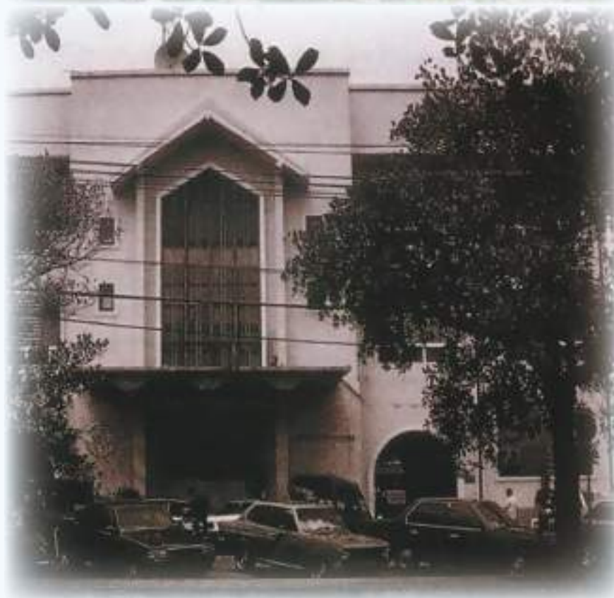
ภาพอาคารกองบัญชาการทหารสูงสุด (เดิม) ถนนราชินี ริมคลองคูเมืองเดิม (คลองหลอด) ปี พ.ศ.๒๕๓๕ Photograph of Supreme Command Headquarters on Rajini Road in 1992