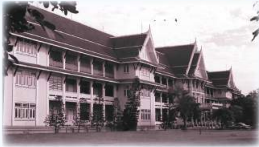
กองบัญชาการทหารสูงสุด เมื่อ ๑๖ มีนาคม พ.ศ.๒๕๐๓

ปัจจุบัน กองบัญชาการกองทัพไทย มีการแบ่งส่วนราชการออกเป็น ๕ ส่วน ได้แก่ ส่วนบังคับบัญชา ส่วนเสนาธิการร่วม ส่วนปฏิบัติการ ส่วนกิจการพิเศษ และส่วนการศึกษา สำหรับอำนาจหน้าที่และความรับผิดชอบ ได้ขยายขอบเขตออกไปจากเมื่อครั้งเริ่มก่อตั้งหน่วยเป็นอันมาก ทั้งนี้ จากการที่กองบัญชาการกองทัพไทยแปรสภาพมาจากกองบัญชาการทหารสูงสุด จึงกำหนดให้วันที่ ๑๖ มีนาคม ของทุกปี เป็นวันสถาปนากองบัญชาการกองทัพไทย สืบเนื่องมาจนถึงปัจจุบัน